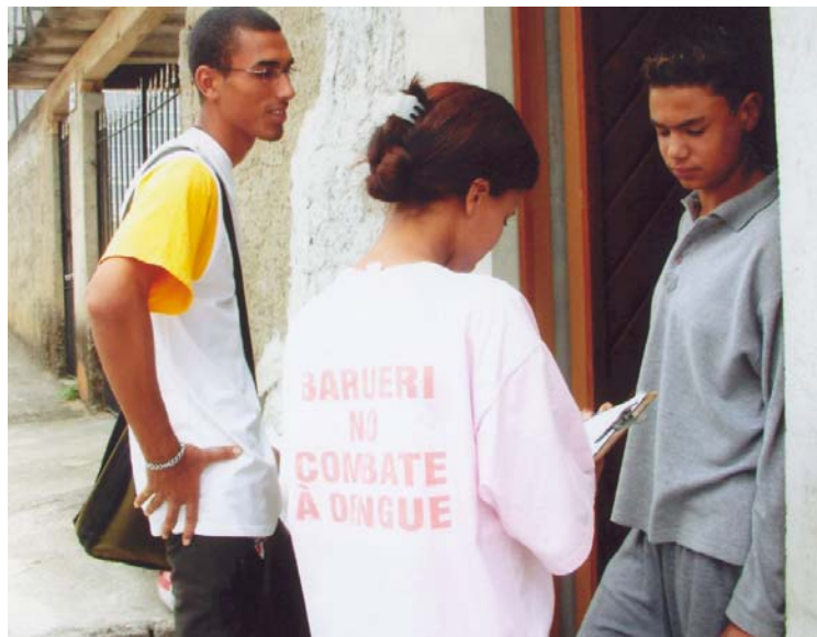
Vitorias acontecem de casa em casa