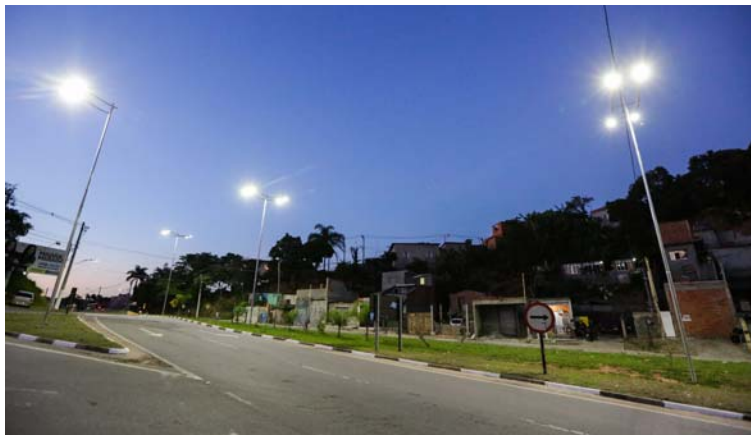
Iluminação pública garante segurança no retorno das aulas ou do trabalho no período da noite