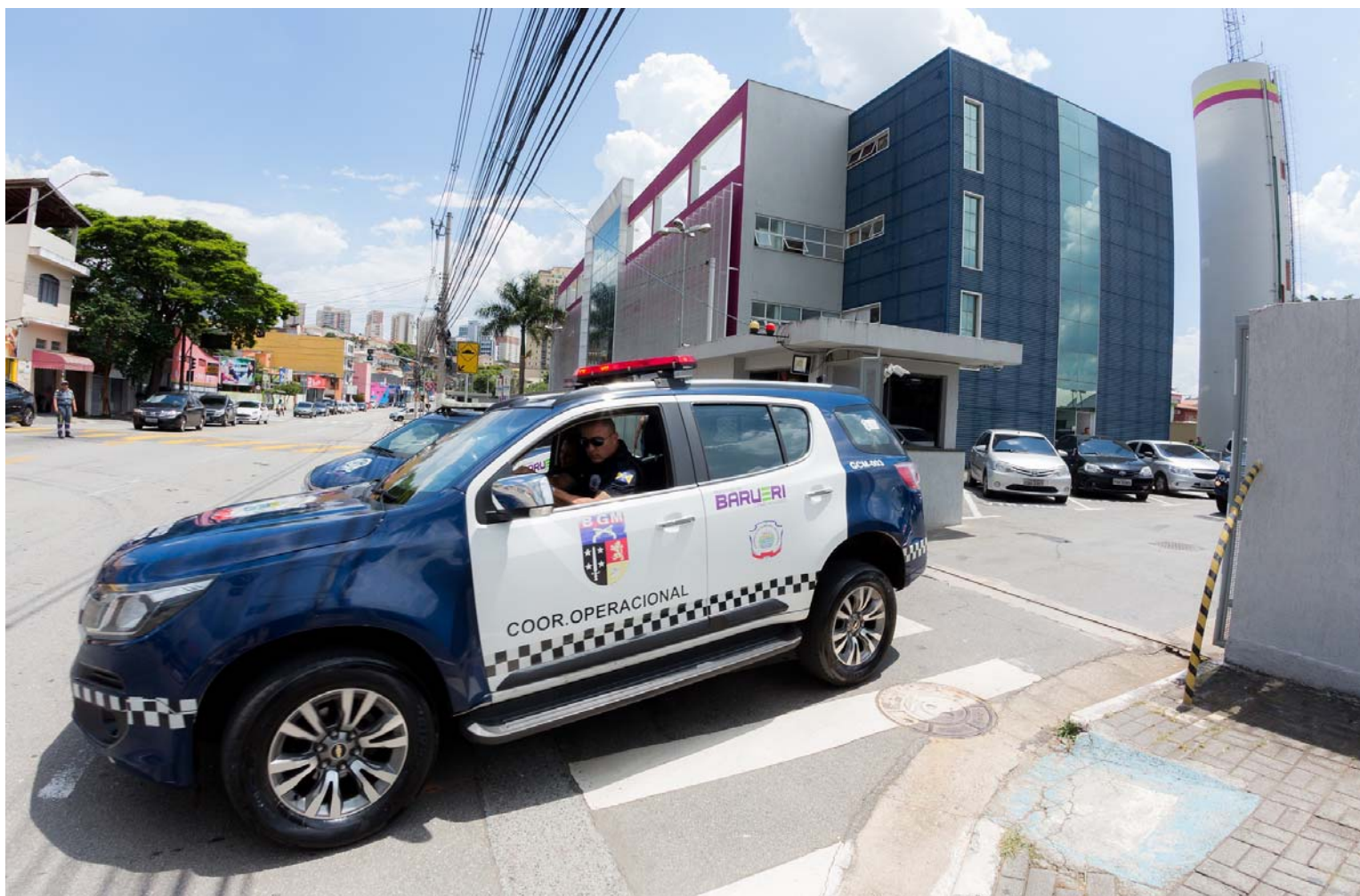
Em 2019 o combate à criminalidade continua. Somente na primeira quinzena do ano, a Guarda Municipal realizou diversas operações de saturação e bloqueios nas áreas que apresentam maior taxa de ocorrências

Em 2019 o combate à criminalidade continua. Somente na primeira quinzena do ano, a Guarda Municipal realizou diversas operações de saturação e bloqueios nas áreas que apresentam maior taxa de ocorrências. Os bairros e comunidades foram patrulhados com o objetivo de coibir o tráfico de drogas, e a sensação de segurança é real pela cidade, visto a quantidade de elogios que chegam através dos aplicativos das ouvidorias da Prefeitura e da Guarda.