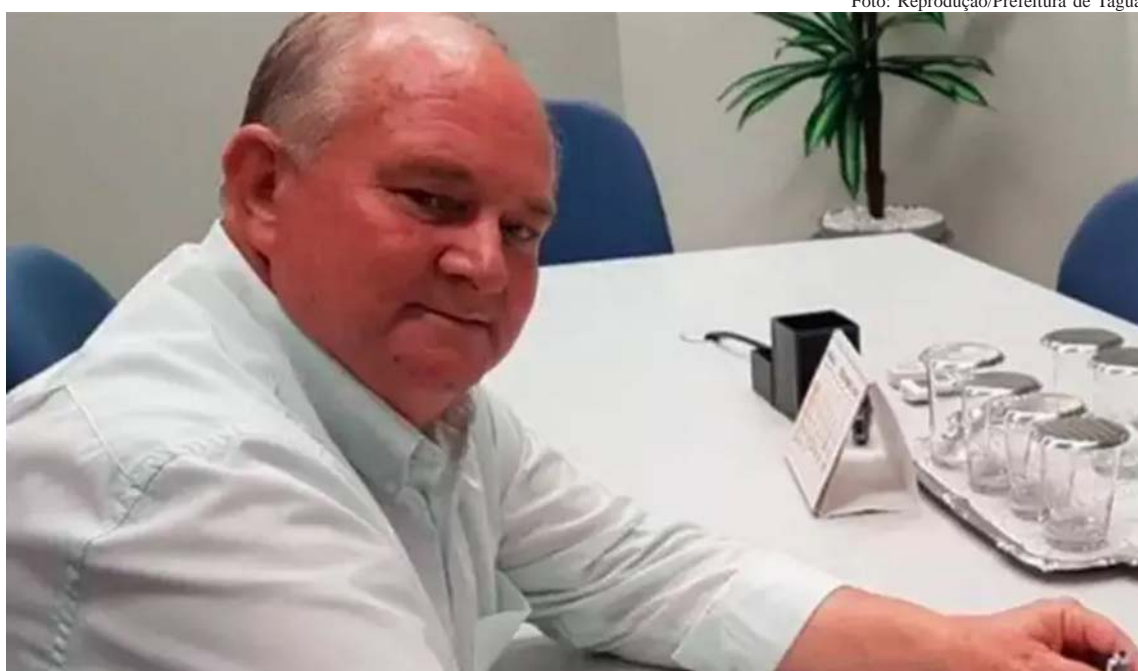
O prefeito de Taguaí, no interior de São Paulo, morreu vítima da Covid-19; ele estava internado em estado grave desde 1º de abril

No ano passado, haviam morrido após contrair a Covid-19 Antonio Shigueyuki Aiacida