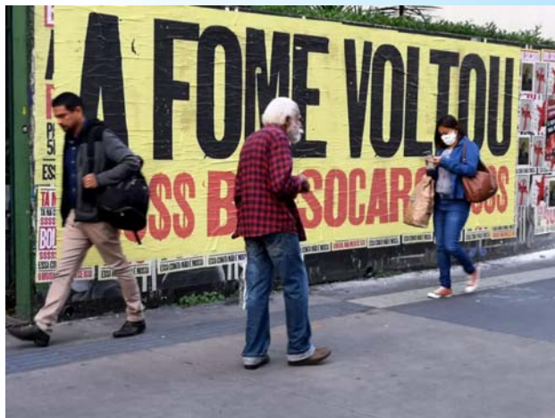
“A fome voltou”: Lambe lambe em muro na Avenida Paulista, em São Paulo.

A Constituição Federal, de 1988, é taxativa ao determinar que a alimentação é um direito social, assim como a saúde, a educação, a moradia, a renda básica, a previdência, entre outros. Logo, precisa ser garantida a todos, independente de terem ou não condições de pagar por isso, e, se houvesse hierarquia entre os direitos, a manutenção da vida deveria, sem dúvida, preceder aos demais. Negar acesso aos direitos, em algumas situações, é uma arma que serve para matar, e os Yanomami são a prova, ainda viva, disso.