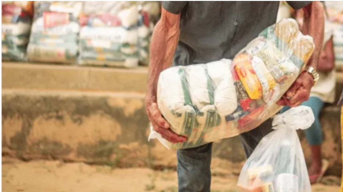
O projeto celebra crescimento de mais de 180% das doações em relação ao ano anterior

Nascido com o propósito de mostrar que a união pode transformar a realidade de muitas pessoas, o Conexão Voluntária, iniciativa formada pelos colaboradores da Claro e empresas do grupo, encerra o ciclo 2022 celebrando o impacto positivo de ações solidárias para a sociedade brasileira. Durante o período, o programa engajou os colaboradores em mais de seis mil e seiscentas participações voluntárias e potencializou sua atuação por meio de parcerias com iniciativas consolidadas como a Ação da Cidadania, na campanha 15 por 15, que uniu forças e mobilizou o time na luta contra a fome no Brasil; a Rifa Solidária, em prol da campanha Mulheres em Foco; e a Campanha do Agasalho.