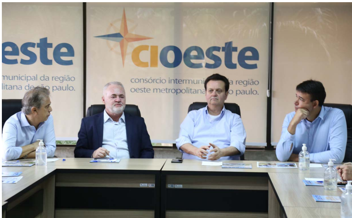
Secretário de Governo e Relações Internacionais do Estado de SP Gilberto Kassab participou de Assembleia de Prefeitos no CIOESTE

O Doutor Sato aproveitou para solicitar apoio ao Governo de SP para investimentos na cidade, incluindo a mobilidade pública, que necessita de melhorias nas vias e na saúde, pedindo auxílio contínuo para a construção do Hospital e Maternidade de Jandira. Como retorno, o prefeito obteve o total comprometimento de Kassab. Na ocasião, ainda, ele conversou com o prefeito de Barueri, Rubens Furlan, e ressaltou que a representatividade que a parceria deles tem resulta em avanços para os moradores das duas cidades.