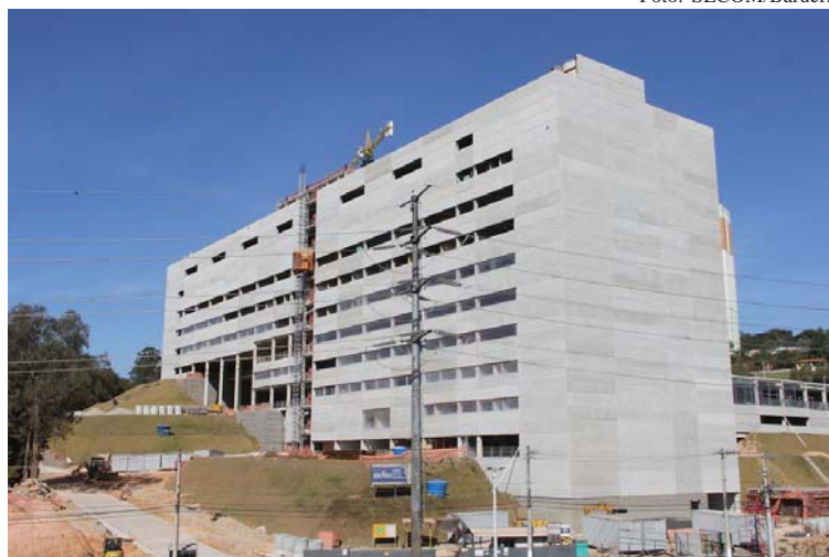
Julho de 2022: Obras do Hospital Regional já chegam a 60%

A previsão de entrega é em abril deste ano.