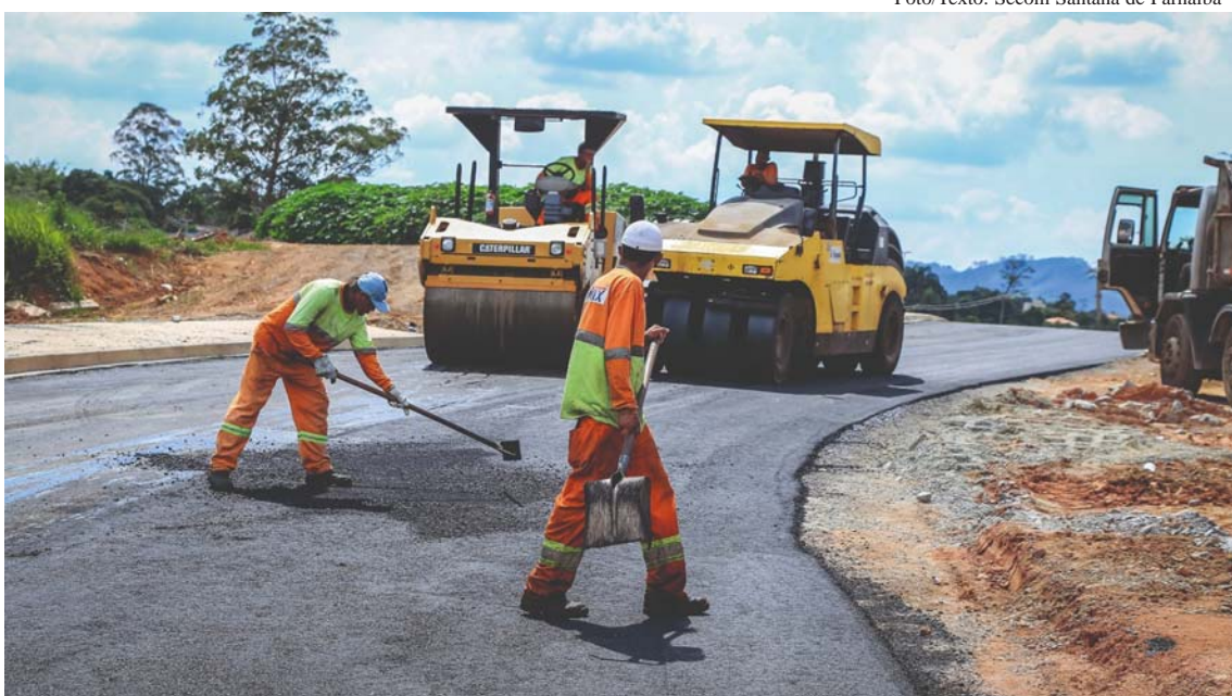
A nova faixa da rua Vereda Tropical recebeu pavimentação na última semana

Na mesma região da cidade, a rua Paraíso, que faz a ligação entre os bairros do Votuparim, Sítio do Morro, Fernão Dias e Estrada do Suru, começou a receber serviços de alargamento para aumentar a capacidade de escoamento e fluidez no trânsito.