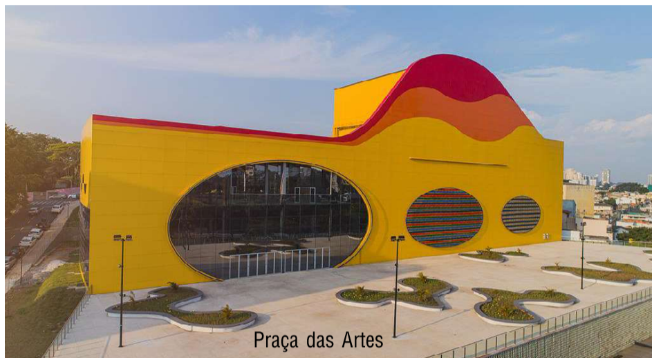
Praça das Artes

Junho em Barueri terá rica programação cultural e Arraiá