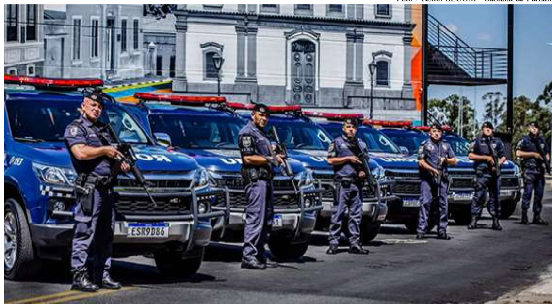
Além dos dados que colocam a cidade como a mais segura, os números ainda indicam redução expressiva em alguns tipos de crime

de veículo (-60%), estupro de vulnerável (-75%) e as incidências de tentativa de homicídio, homicídio doloso e roubo de carga, que reduziram em 100%. Fora isso, o indicador de latrocínio permaneceu zerado. A permanência como a cidade com os menores indicadores criminais se deve às políticas públicas realizadas pela gestão ao longo dos últimos 10 anos, entre os quais estão os treinamentos constantes da GCM, aquisição de armamentos e equipamentos, implantação de iluminação de LED em todo o município e instalação da delegacia da mulher.