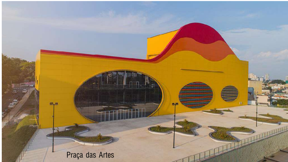
Praça das Artes

Uma intensa programação cultural movimentará a cidade de Barueri neste mês de junho. A Secretaria de Cultura e Turismo (Secult) promove diversas atividades teatrais, literárias e musicais para todos os gostos na Praça das Artes, no Centro de Eventos e também em frente ao Ginásio Poliesportivo José Corrêa, onde haverá 11 noites consecutivas de shows de artistas consagrados e os frequentadores poderão saborear muitas comidas típicas no Arraiá 2023.