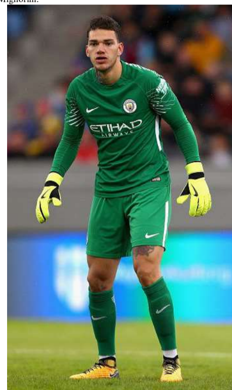
Ederson Moraes, goleiro do City e nascido em Osasco, será o único brasileiro presente na final da maior competição de futebol de clubes da Europa

bandeira de Osasco chegue aos quatro cantos do mundo.