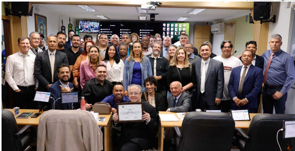
Moção aplaude trabalho da ASEMORIG - Associação Empresarial de Órgãos de Imprensa da Grande SP