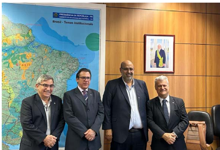
Gilberto Carvalho - Secretário de Economia Solidária, Luiz Marinho - Ministro do Trabalho, Sergio Ribeiro e Luizinho - Equipe de trabalho

usar no gabinete de prefeito e eu respondi que estou precisando de uma mesa”, ressaltou Sergio Ribeiro - ex-prefeito de Carapicuíba, durante sua visita de reivindicações no Palácio do Planalto.