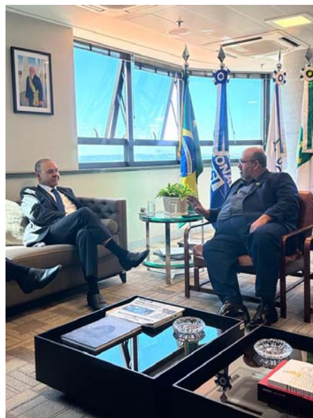
Vagner Freitas - Presidente do Senai e Sergio Ribeiro, durante reunião em Brasília/DF