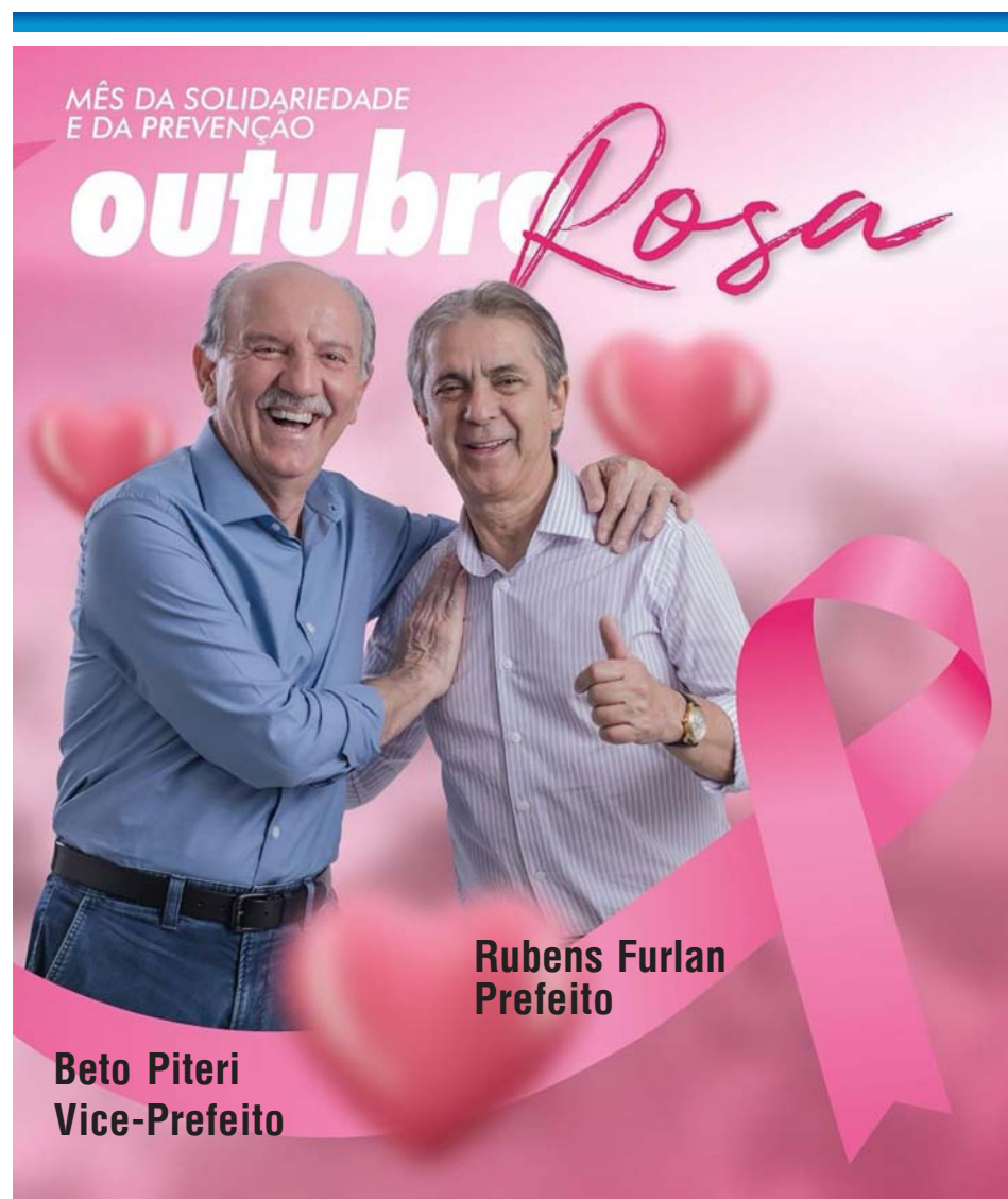
Rubens Furlan Prefeito

Muito bem recebida, a equipe do Cetas foi levada a um tour pela propriedade, de beleza exuberante e cujo trabalho de preservação deixou a todos muito admirados. Uma trilha em madeira que circunda o terreno permite um rico passeio por dentro da mata entre uma enorme diversidade de flora, biomas e até espécies inusitadas, como emas, pavões, lhamas e vários outros animais, além de um grande viveiro de aves onde brilham lindas araras azuis, pica-paus e dezenas de outros pássaros.