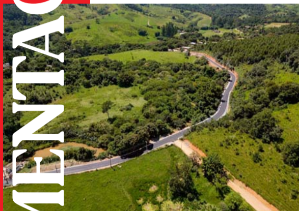
Estrada do Rio Acima pavimentada!

A cidade de Araçariguama está testemunhando um momento histórico com a implantação do maior programa de pavimentação já realizado. Entre este marco está a pavimentação asfáltica da Estrada do Rio Acima.