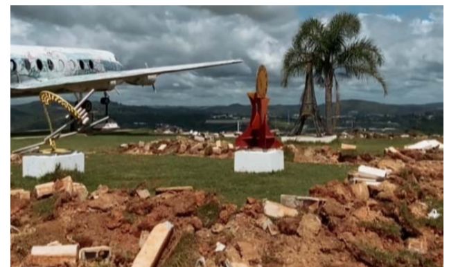
Reforma Praça do Avião