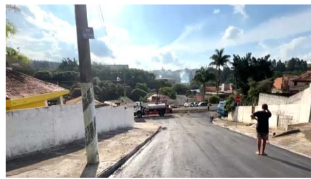
Recapeamento Vila Real