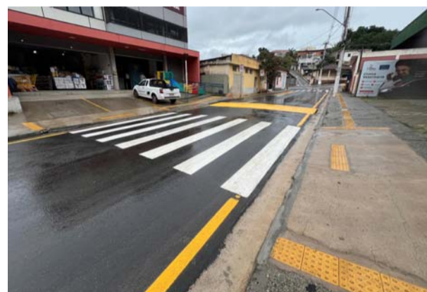
Rua Coronel Augusto, no Centro é totalmente recapeada

O bairro Bom Jardim também está passando por uma transformação significativa, com um projeto