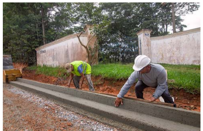
Guias em Aparecidinha: As obras estão presentes em todos os cantos da cidade