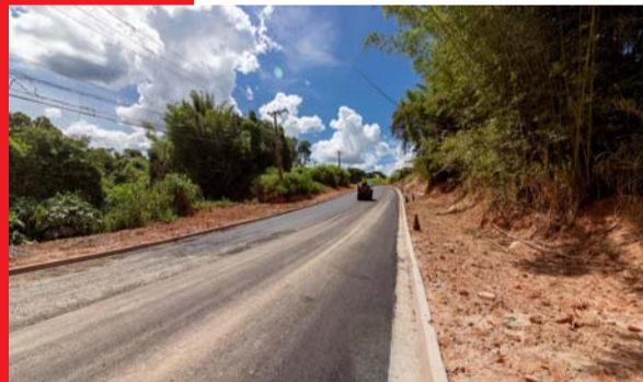
Pavimentação no Bairro Bom Jardim

Além disso, o Programa de Pavimentação da Prefeitura beneficiou diversos bairros, incluindo Vila Alumínio, Vila Nova e a Vila Real, que receberam pavimentação asfáltica em todas as suas vias. Futuramente, outros bairros também serão contemplados por este ambicioso projeto, considerado o maior já realizado em Araçariguama.