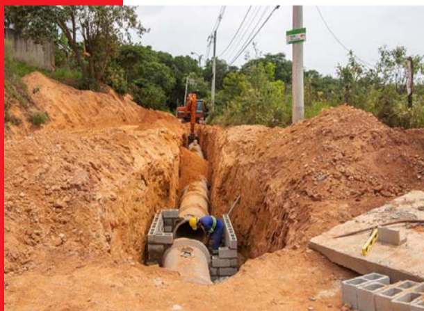
Pousada dos Bandeirantes