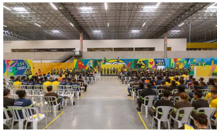
Em pouco mais de três anos, mais de 736 novas empresas foram estabelecidas na cidade, gerando um aumento significativo no mercado de trabalho.