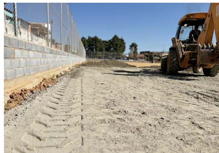
Situado no bairro Jardim Brasil, o novo espaço esportivo recebe um investimento considerável de R$ 1,5 milhão

A gestão atual de Araçariguama está empenhada em promover e ampliar as políticas públicas relacionadas ao esporte e ao lazer da população. Uma série de projetos foi elaborada para atender às necessidades e contemplar diversas modalidades em diferentes bairros do município. Um dos destaques desse período de prosperidade para o esporte local é a construção da 'Arena Araçarizão'. Esta iniciativa, há muito tempo esperada pelos esportistas da cidade, representa um marco significativo para Araçariguama. Situado no bairro Jardim Brasil, o novo espaço esportivo recebe um investimento considerável de R$ 1,5 milhão. A arena contará com arquibancadas, lanchonete, playground, banheiros para o público, dois vestiários para times, um vestiário para a arbitragem, guarita de segurança, pista de skate, pista de caminhada, gramado sintético, sistema de iluminação, paisagismo, alambrados e outras melhorias. As obras estão em pleno andamento e em breve, Araçariguama terá um dos melhores campos esportivos da região.