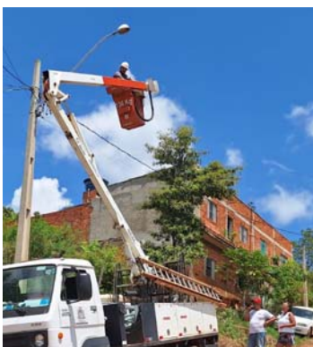
Iluminação pública na Rua Tulipa, no bairro Santaella

O Programa Ilumina Araçá está promovendo uma modernização completa da iluminação pública em toda a cidade! A substituição das antigas lâmpadas convencionais por