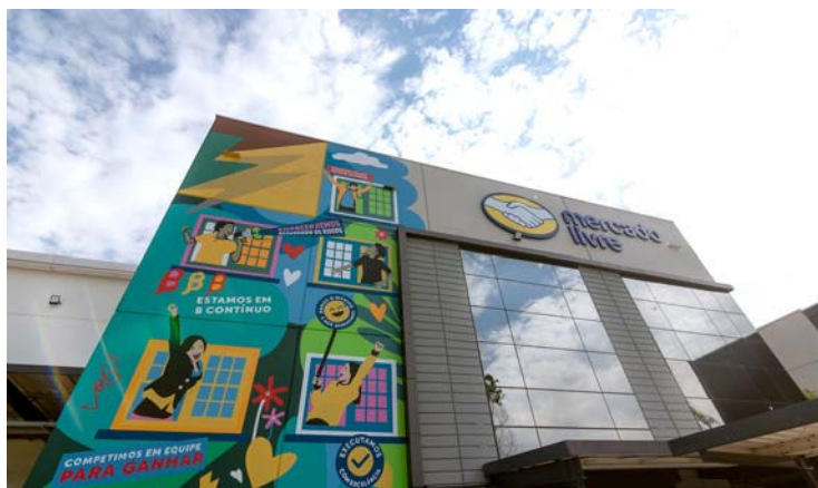
Hoje Araçariguama é reconhecido como uma das principais forças produtivas e de arrecadação da região, abrigando gigantes como Mercado Livre