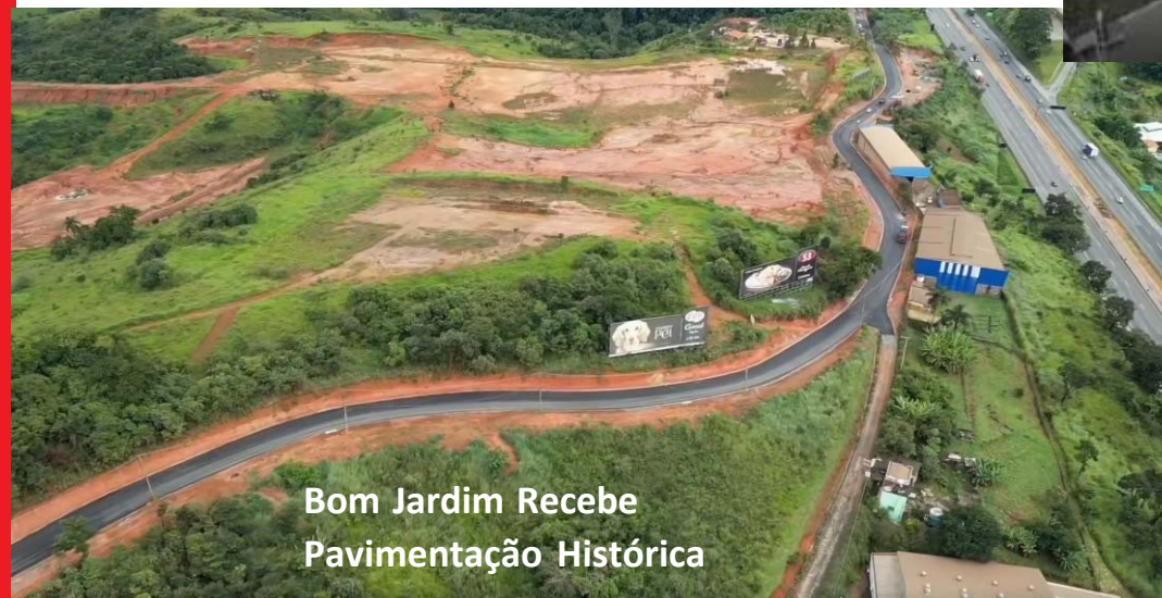
Bom Jardim Recebe Pavimentação Histórica