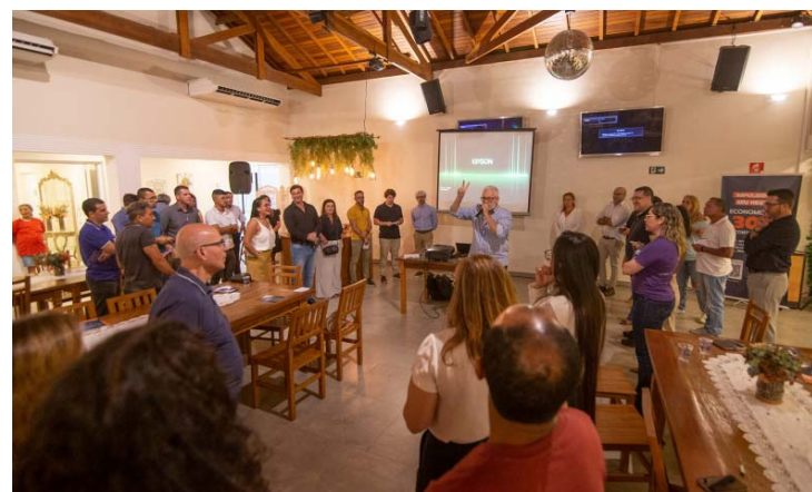
Rodada de Negócios