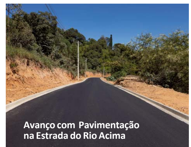
Avanço com Pavimentação na Estrada do Rio Acima