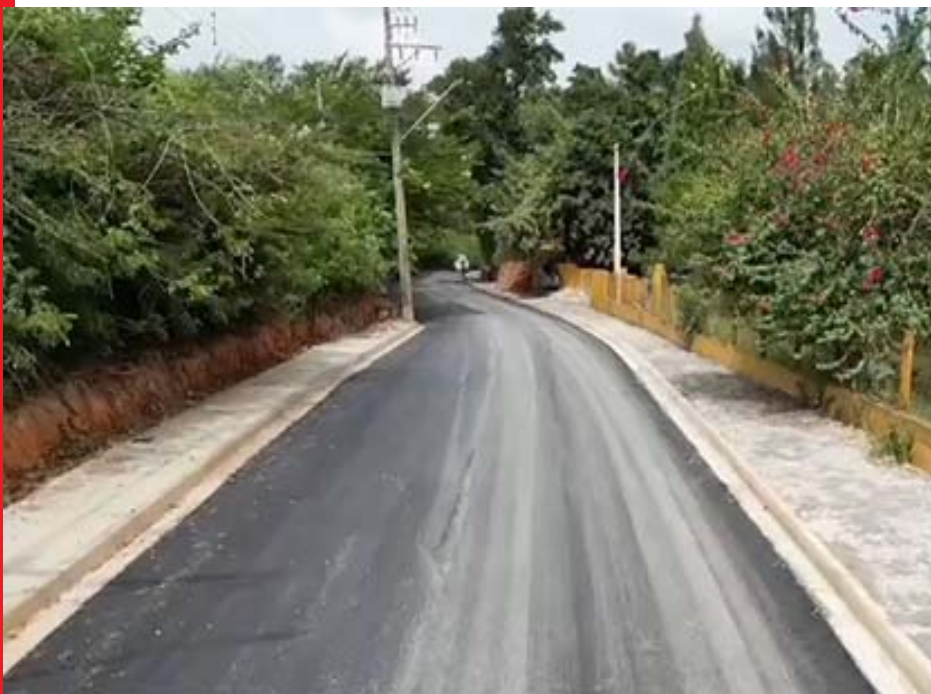
Aparecidinha Recebe Pavimentação Asfáltica

Este projeto demonstra o compromisso da administração municipal em melhorar a infraestrutura viária da cidade, garantindo mais segurança e conforto para todos os moradores de Araçariguama.