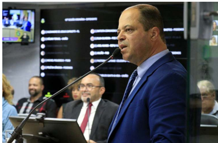
Parlamentar osasquense assume cadeira em Brasília a partir de 2025