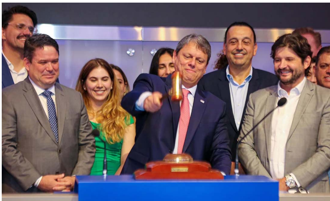
Pregão aconteceu na sede da B3 - Bolsa de Valores, em São Paulo

“Queremos deixar um legado. Queremos um Estado que ande na direção certa. E isso traduz o que estamos fazendo. Quando me perguntam qual é a maior entrega do governo, digo que é o SP na Direção Certa. Estamos fazendo o que precisa ser feito: uma reforma administrativa para diminuir o