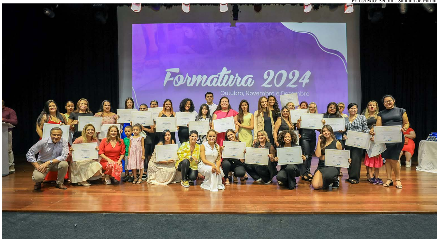
Cerimônia foi realizada na Arena de Eventos, com a presença de familiares e amigos dos formandos

A Secretaria da Mulher e da Família oferece diversos cursos, entre eles Pintura em Tela, Técnicas em Vendas, Massagem Corporal, Manicure e Pedicure e Bonecas de Pano. Mais informações sobre cursos disponíveis podem ser obtidas pelo telefone: 4154-6248.