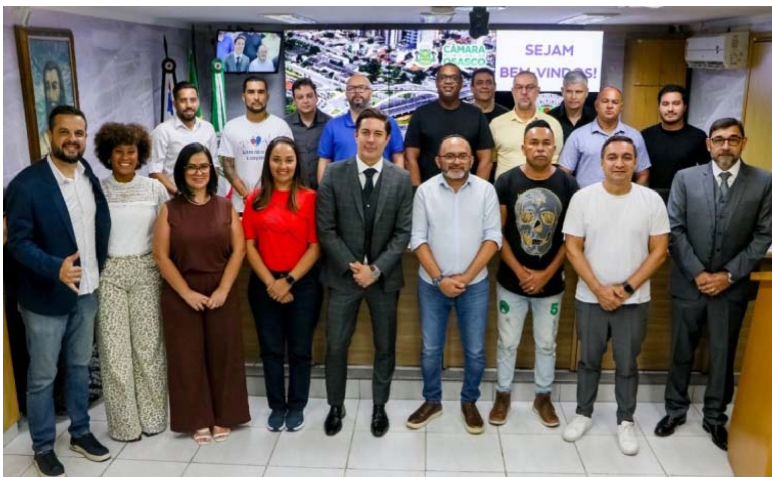
Iniciativa serviu para orientar, esclarecer dúvidas e estreitar laços institucionais