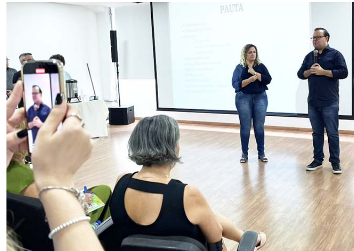
Os diretores de todas as escolas municipais de Cotia participaram da reunião que contou com a presença do prefeito Wellington Formiga