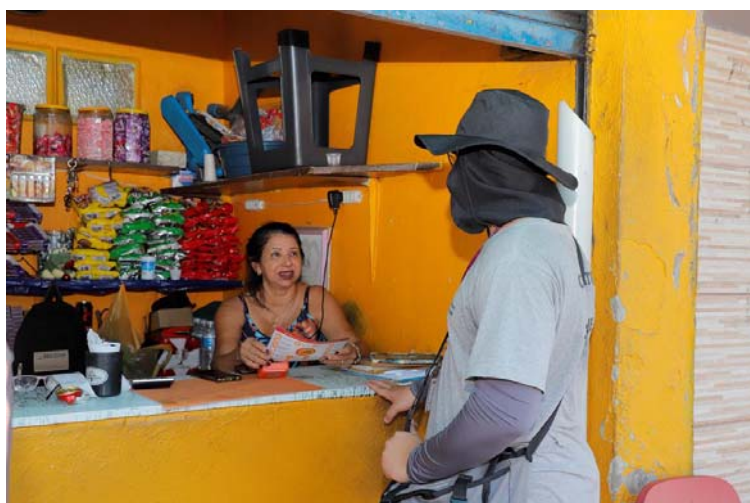
Vários mutirões já foram realizados neste ano para reforçar o alerta contra a doença

Vários mutirões já foram realizados neste ano para reforçar o alerta contra a doença e proteger moradores e visitantes de Barueri nas regiões do Parque dos Camargos, Vila