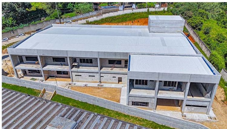
As três novas unidades educacionais estão com obras avançadas e a previsão é de que sejam entregues até o final deste ano

Já o novo colégio do Jaguari está com 60% das obras concluídas, e atualmente estão sendo realizadas a execução de gesso, instalações elétrica e hidráulica, aplicação de argamassa e instalação dos batentes das portas. O novo equipamento educacional será construído em uma área total de 2.496,79 m 2