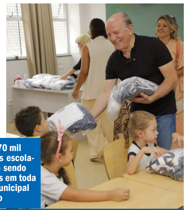
Mais de 70 mil uniformes escolares estão sendo entregues em toda a rede municipal de ensino