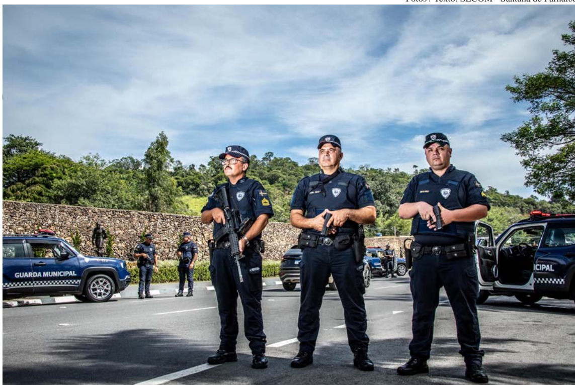
As operações Impacto e Cidade Segura são algumas das ações que contribuem para a redução da criminalidade no município

A permanência de Santana de Parnaíba como a cidade com