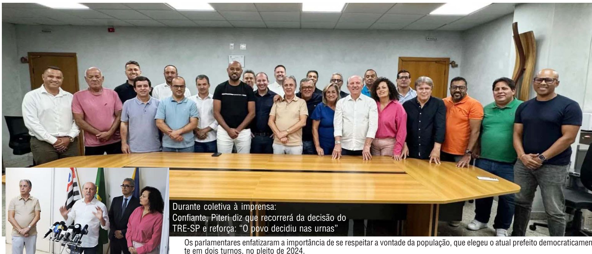
Durante coletiva à imprensa: Confiante, Piteri diz que recorrerá da decisão do TRE-SP e reforça: “O povo decidiu nas urnas”

Os parlamentares enfatizaram a importância de se respeitar a vontade da população, que elegeu o atual prefeito democraticamente em dois turnos, no pleito de 2024.