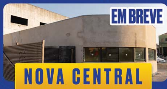
NOVA CENTRAL DE MONITORAMENTO