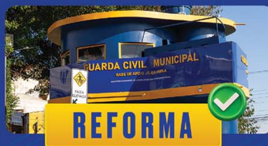
REFORMA BASE JD. GABRIELA