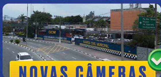
NOVAS CÂMERAS DE MONITORAMENTO