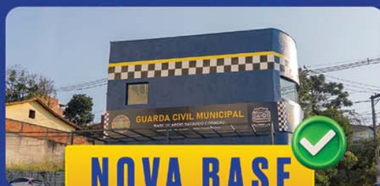
NOVA BASE SAGRADO CORAÇÃO