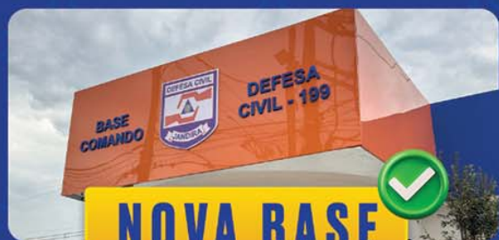
NOVA BASE DEFESA CIVIL