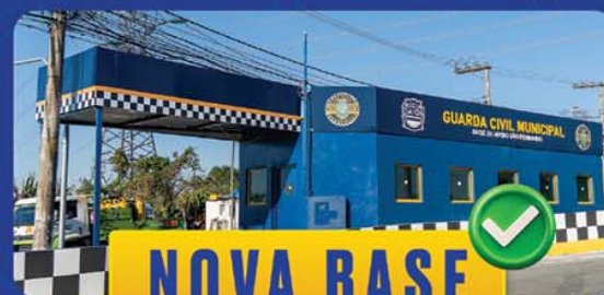
NOVA BASE SÃO FERNANDO