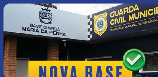
NOVA BASE MARIA DA PENHA