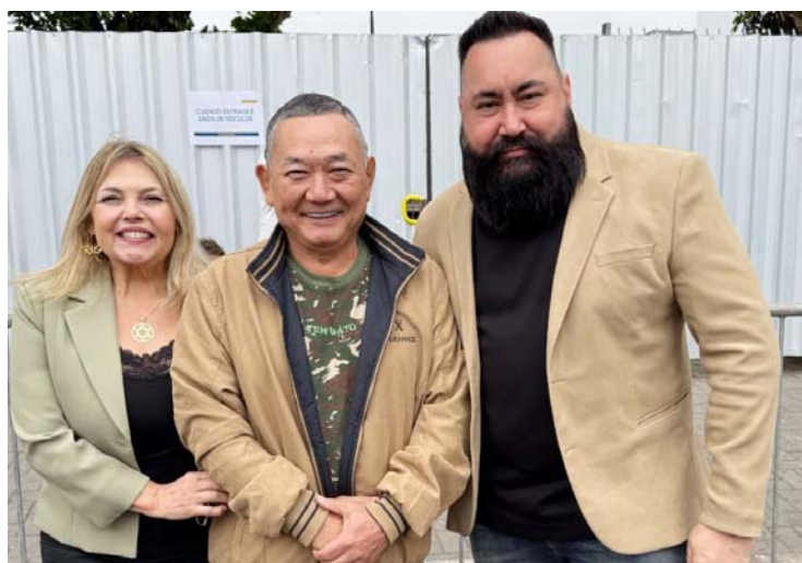
Evento reuniu escolas, entidades locais e autoridades para comemorar os 201 anos da Independência do Brasil

A cidade de Jandira celebrou, com grande entusiasmo, os 201 anos da Independência do Brasil com um desfile cívico-