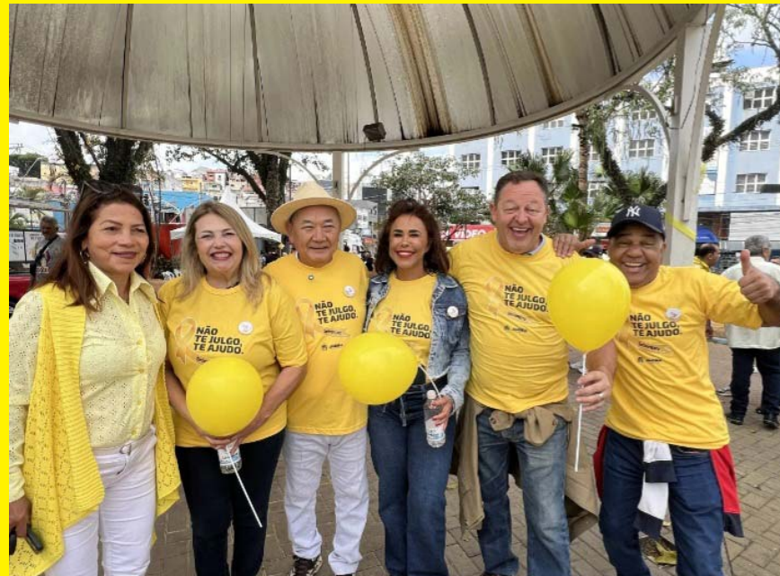
O povo jandirense mostrou, mais uma vez, a força de sua mobilização e a relevância da mensagem: "Não te julgo, te ajudo".