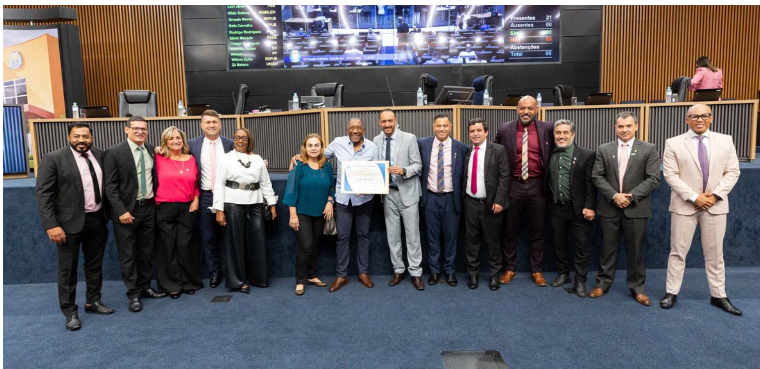
Empresário, palestrante e escritor se destacou no mundo dos negócios e hoje é referência para milhões de pessoas