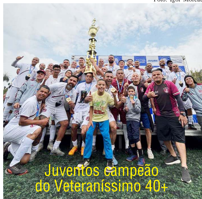
Juventus campeão do Veteraníssimo 40+