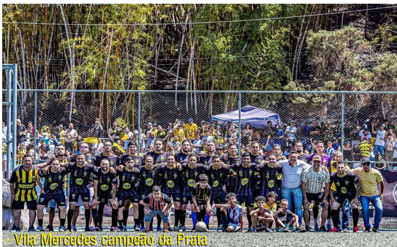
Vila Mercedes campeão da Prata