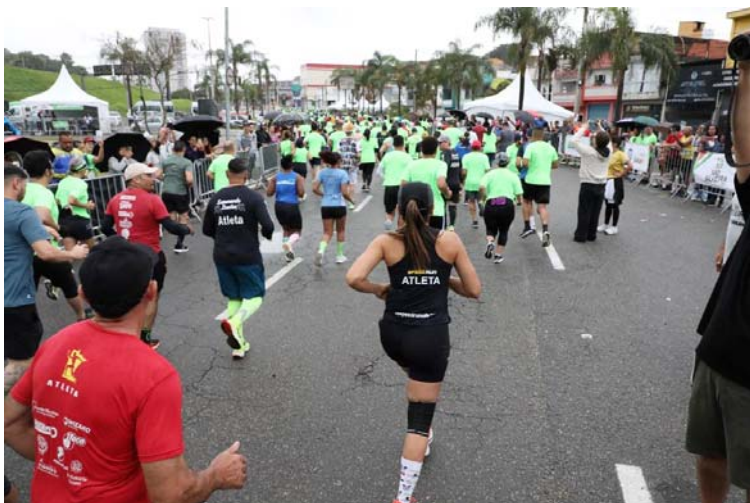
Com premiações que chegaram a R$ 5 mil, a Corrida São Silveira vai além de uma competição esportiva.

Com premiações que chegaram a R$ 5 mil, a Corrida São Silveira vai além de uma competição esportiva. Ela promove saúde, bem-estar, superação e espírito esportivo, além de movimentar a cidade e fortalecer a tradição do esporte em Barueri.