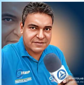
Editor e Jornalista responsável: Fábio Mendonça Silveira MTB 54.249/SP

É momento de se reencontrar, reconectar, permanecer em paz que vem muita coisa pela frente. Te prepara vida, vem aí mais um novo ano que já é um velho conhecido seu.